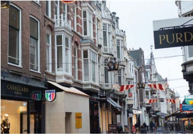
Winkels met erkers aan het Noordeinde in Den Haag. B. Kooij 2016